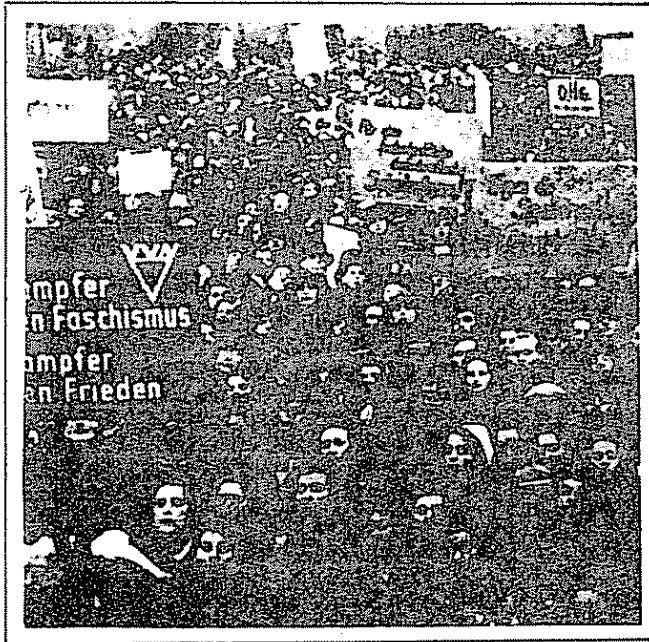
Concentraciones de masas en 1948 en la parte oeste de Berlin contra el reformatamiento del imperialismo alemán

se a esas particularidades, el proletariado de Berlin Occidental se orienta en genral, y de una forma espontánea, unilateralmente hacia el contexto de las luchas del movimiento obrero en Alemania Occidental. Esa orientación unilateral es incompatible con los intereses de largo plazo del proletariado de Berlin Occidental, los cuales hacen necesaria, en la lucha por la revolución proletaria y la instauración de la Dictadura del proletariado, la construcción de una estrecha alianza de combate con el proletariado de la RDA.