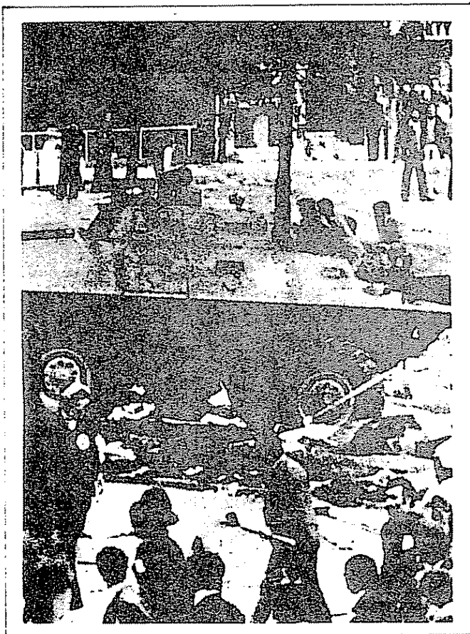
1 de Mayo 1977: Lucha de los revolucionarios en Estambul contra el aparato de estado facista

El PCT/ML fué la única Organización que, desde un principio, declaró que el Partido popular Republicano (CHP) de Ecevit, al igual que los otros partidos que hoy están representados en el Parlamento, es un partido de la burguesía compradora y de los terratenientes, y que el CHP, al igual que los otros partidos de la clase dominante, es un partido facista y que practicaría el facismo en cuanto llegara al Gobierno.