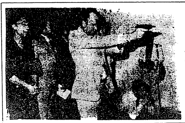
Jefes policiales turcos y germano- occidentales en ejercicios de tiro en el BKA

También el imperialismo germano-occidental fortalece sus posiciones en Turquía. En el momento, éste es el dador de créditos más importante y el "partner" comercial de más peso en Turquía. Es decir, posee el mayor porcentaje de las naciones imperialistas en la explotación de Turquía. En la cuestión de la "ayuda inmediata" para el "saneamiento de la economía turca" existe una "división del trabajo" entre las potencias imperialistas occidentales, cuya base se formulara en el encuentro de los cuatro Carter-Schmidt-Giscard D'Estaing-Callaghan en Guadalupe a principios de 1979. De acuerdo a esa "división del trabajo", el imperialismo germano-occidental ha asumido en la así llamada "acción de saneamiento" el rol de representante de las potencias imperialistas occidentales.