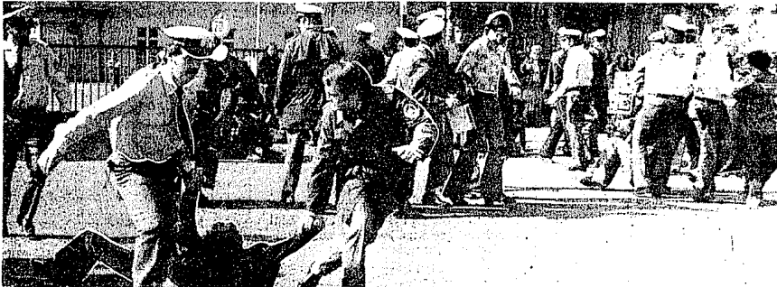
Ya en 1969 y 1973 el estado utilizó su máquina de violencia para terminar