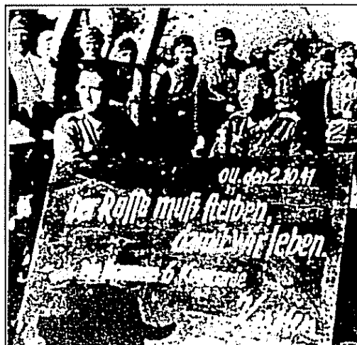
"El ruso tiene que morir para que vivamos nosotros" - grito de guerra de la Wehrmacht alemana fascista durante la invasión de la Unión Soviética socialista de Stalin

Tras la derrota de los nazis en la Segunda Guerra Mundial, esa tradición continuó. Ciertamente que habían sufrido un fracaso, pero sus ideólogos no habían desaparecido. Ciertamente que el imperialismo alemán fue vencido, pero ni con mucho fue destruido, por el contrario, volvió a cobrar fuerza. En Alemania Occidental el capital se fortalecía cada año más y otra vez se creaba un ejército agresivo en la tradición de la Wehrmacht, el ejército federal "Bundeswehr". Como principal lema para justificar una guerra contra "el Este", nuevamente se elegía la "lucha contra el comunismo". Se decía que, aunque la guerra desde 1939 hasta 1945 fue una mala cosa por parte de los imperialistas alemanes (sobre todo porque fueron vencidos), sin embargo, Stalin no fue en absoluto mejor que Hitler, etc.