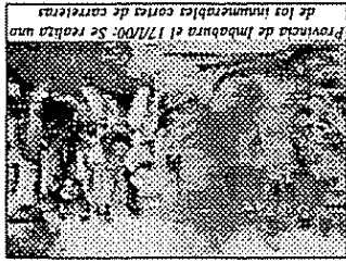
Provincia de Imbabura el 17/100. Se ve a una de las manifestaciones cortes de carreteras de los habitantes de la zona.