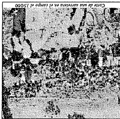
Corte de una carretera en el campo el 15/100.