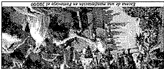
Escena de una manifestación en Portoviejo el 20/100.