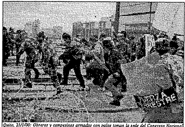
Quito, 21/1/00: Obreras y campesinas armadas con palos toman la sede del Congreso Nacional