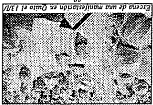
Escena de una manifestación en Quito el 13/100.