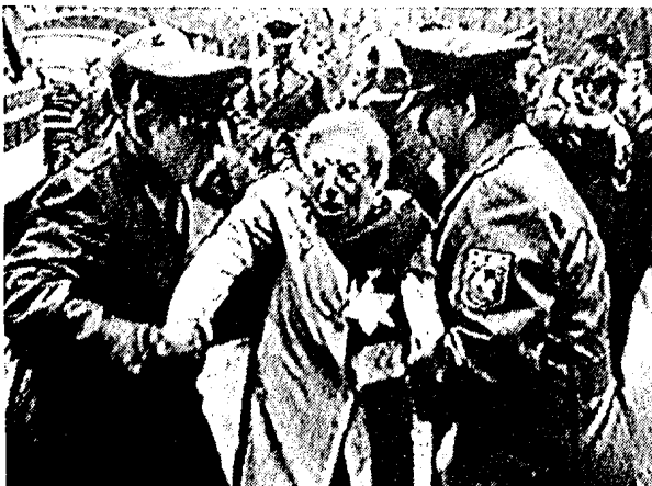
Mai 1985: Die westdeutsche Polizei führt im KZ Bergen-Belsen protestierende Juden ab.

Daß die Traditionen des Hitlerfaschismus fortleben, tiefe Wurzeln haben und offiziell gehegt und gepflegt werden, hat auch ein anderes Ereignis der letzten Zeit gezeigt: die Ehrung der Soldaten der faschistischen Wehrmacht und der Waffen-SS durch Kohl und Reagan in Bitburg im Mai 1985.