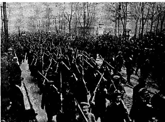
Der bewaffnete Kampf der Arbeiterklasse ist keine Utopie. Aus der Geschichte lernen: Aufmarsch bewaffneter Arbeiter in Berlin, Novemberrevolution 1918/19.

Die DGB-Führung gibt die Parole aus: Bei den Wahlen 1987 zeigen wir's dem Kapital mit dem Stimmzettel! Und GRÜNE und DKP verbreiten dieselben Illusionen. Die DGB-Führung macht direkt und indirekt Reklame für die Wahl der SPD. Die Losung des "kleineren Übels" ist auf Leute mit kurzem Gedächtnis, auf die Unerfahrenen, auf die Jungen berechnet, die nicht wissen, schon vergessen haben oder nicht wissen wollen, daß zur Zeit der sozialdemokratischen Regierung Schmidt die Faschisierung auf allen Gebieten vorangetrieben, die Aufrüstung forciert wurde, die Aussperrung legitimiert war, die Zahl der Arbeitslosen auf zwei Millionen stieg usw. usf. Die SPD ist nicht das "kleinere Übel" , sondern die Tatsachen zeigen, daß sie im Endeffekt ebenso Sachverwalter im Interesse des Monopolkapitals ist wie die CDU. Die "linken" Töne, die sie jetzt, aus ihrer Oppositionsrolle heraus, spuckt, sollen darüber nur hinwegtäuschen.