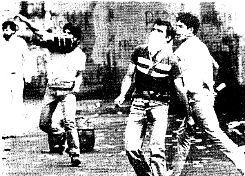
Trotz faschistischem Terror in Chile: Mai-Demonstration von mehr als 20 000 Menschen.

Nötig wären machtvolle Beweise der Solidarität der Arbeiterklasse Westdeutschlands mit ihren Klassenbrüdern überall auf der Welt im gemeinsamen Kampf gegen Ausbeutung und Unterdrückung. Denn ebenso wie der Imperialismus international ist,