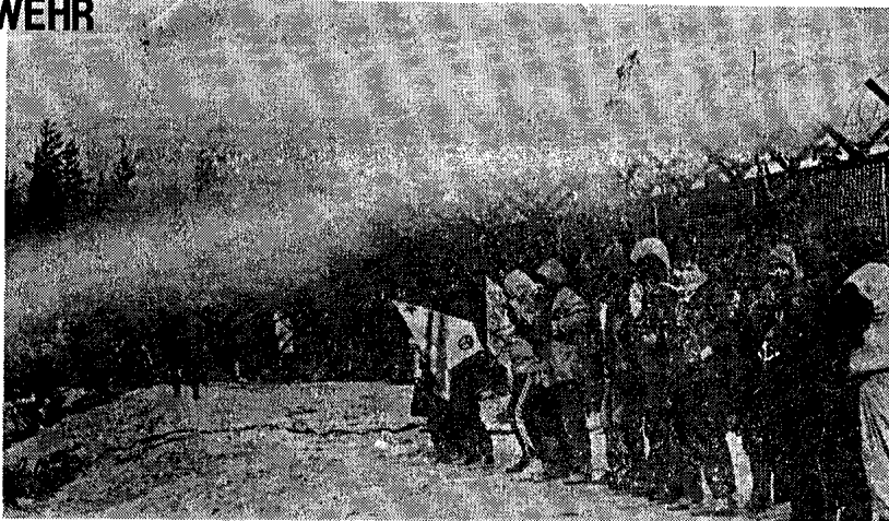
Demonstranten beim Angriff auf den Bauzaun in Wackersdorf.

Doch das Projekt Wackersdorf wird nicht ohne Widerstand hingenommen. Trotz massivem Polizeieinsatz, bei dem schon 2 Tote zu beklagen waren, trotz Bürgerkriegsmanövern demonstrierten fast 100 000 Menschen, um den Bau-