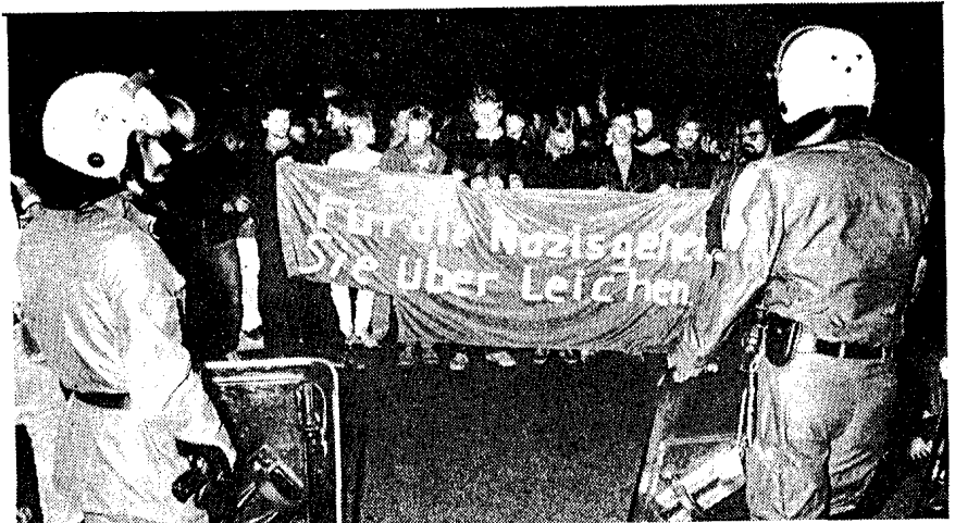
Eine der vielen Demonstrationen in Frankfurt gegen den Mord an Günter Sare (Herbst 1985).

Tausende gingen danach auf die Straße, vor allem Jugendliche. Nicht nur in Frankfurt, sondern auch in vielen anderen Städten erhob sich eine Welle der Empörung. Aber erst wenn verstärkt und hauptsächlich Arbeiterinnen und Arbeiter zum Kampf gegen offene Faschisten und den Staat, der diese Banden schützt, antreten, wird der antifaschistische Kampf die nötige Durchschlagskraft erhalten.