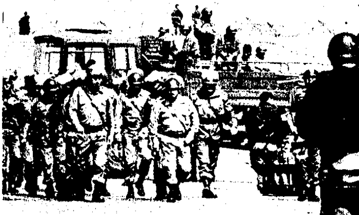
Peruanisches Militär im Anmarsch auf ein Gefängnis