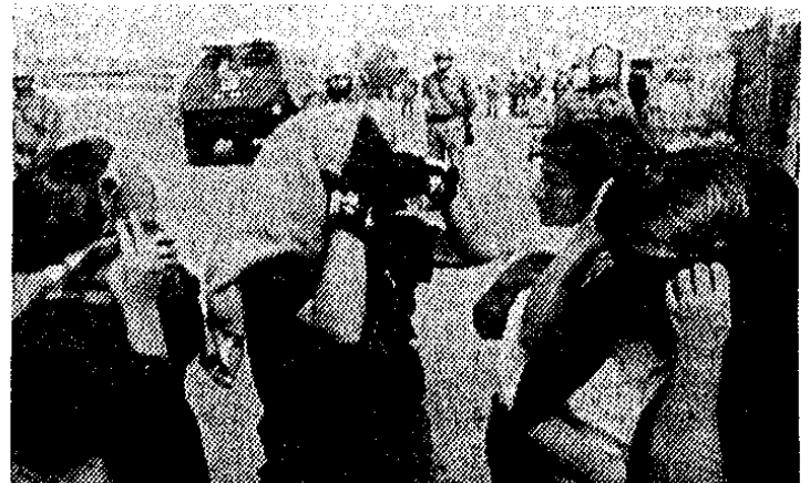
Westdeutscher Radpanzer gegen Angehörige der Gefangenen

SOLIDARITÄT MIT DEM BEWAFFNETEN BEFREIUNGSKAMPF IN PERU !