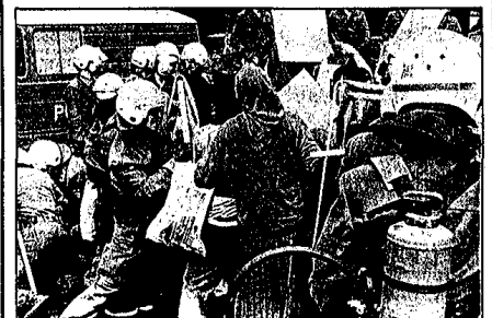
Polizisterror gegen demonstrierende Kurdinnen

Das Ziel dieser dreckigen Methode war und ist es, nicht nur eine chauvinistische Stimmung gegen alle “Nichtdeutschen” zu schüren, sondern auch Verunsicherung und Verwirrung zu stiften, einen Gewöhnungseffekt zu erzeugen, der dazu führt, daß Protest und Widerstand sich erst gar nicht entwickeln. “Man kann ja nicht genau sagen, ob es wirklich Nazis waren” - diese Stimmung hat sich in weiten Teilen der westdeutschen “Linken” breitgemacht. Protest oder Widerstand, wie noch gegen die Nazi-Morde in Mölln oder Solingen, ist bisher nicht zu verzeichnen. Die Verwirrungstaktik der west/deutschen Bourgeoisie hat Erfolg. Die Macht der Gewohnheit, diese fürchterlichste Macht der Bourgeoisie, ist der Boden, auf dem solche Stimmungen gedeihen und sich ausbreiten können. Denn inzwischen ist es brutaler Alltag, daß eine Flüchtlingsunterkunft brennt und Dutzende, ja Hunderte von Flüchtlingen sich meist nur durch Glück und Zufall vor den Flammen retten können.